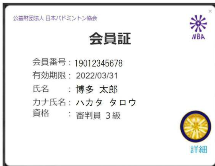
【審判資格ありの会員証】